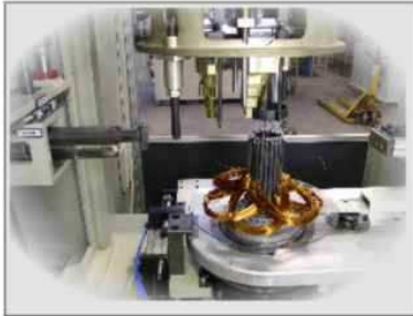
COIL WINDING UNIT

modello / model "TAIV 2.02/S-M-L" for size IEC 56-100/80-160/100-200