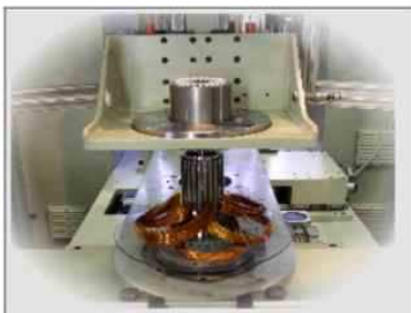
COIL INSERTING UNIT