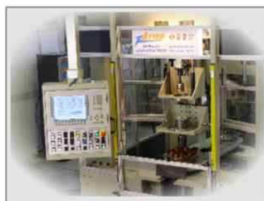
STATION OF LOAD