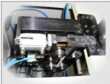
WEDGE MAKING UNIT